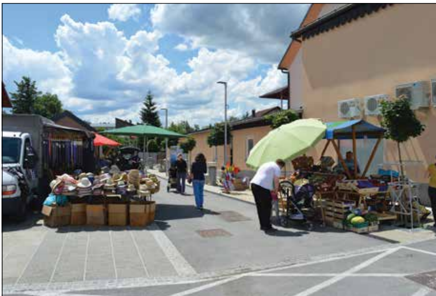
Na cerkniški tržnici se je v preteklem letu predstavilo 22 različnih ponudnikov.