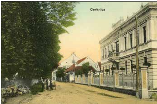
Na začetku 20. stoletja posojilnica, sedaj občina.

Z mape franciscejskega katastra iz leta 1823 je razvidno, da je Cerknica spadala pod kresijo Postojna in okraj Haasberg. Stavbe so bile skoncentrirane ob dveh glavnih cestah Veliki gasi (Partizanska cesta) in Mali gasi (Gerbičeva cesta), pred mostom čez Cerkniščico ter na Taboru in okrog njega, kjer so se srečale tudi vse takratne cerkniške poti in ceste.