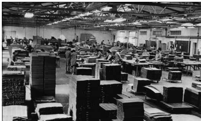
Tovarna pohištva Brest Cerknica.

V Cerknici je ob Cerknjiščici delovalo več mlinov in žag. Na mestu, kjer je nekoč stala Šerkotova žaga, je zrasla Tovarna pohištva Brest. Podjetje, ki je nastalo iz manjših